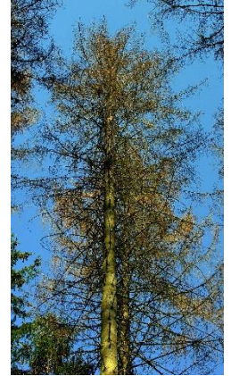
Epicéa dépérissant

Les effets de ces dépérissements qui apparaissent sur les paysages forestiers peuvent avoir un impact sur la sécurité des usagers de la forêt. Il convient d'être d'autant plus vigilant en période de déconfinement.