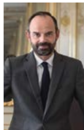
Édouard Philippe, Premier ministre

« Parce que l'industrie est profondément « extraordinaire » et parce qu'elle est source d'innovation, d'emploi, de souveraineté et de cohésion de nos territoires, nous avons engagé, depuis un an, une stratégie déterminée de reconquête industrielle autour du Conseil National de l'Industrie et de ses 18 filières industrielles.