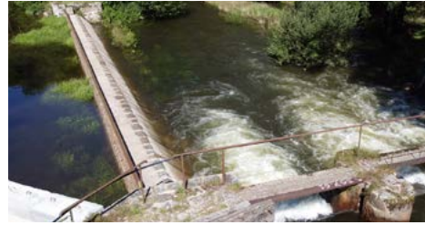
Déversement à la Cure