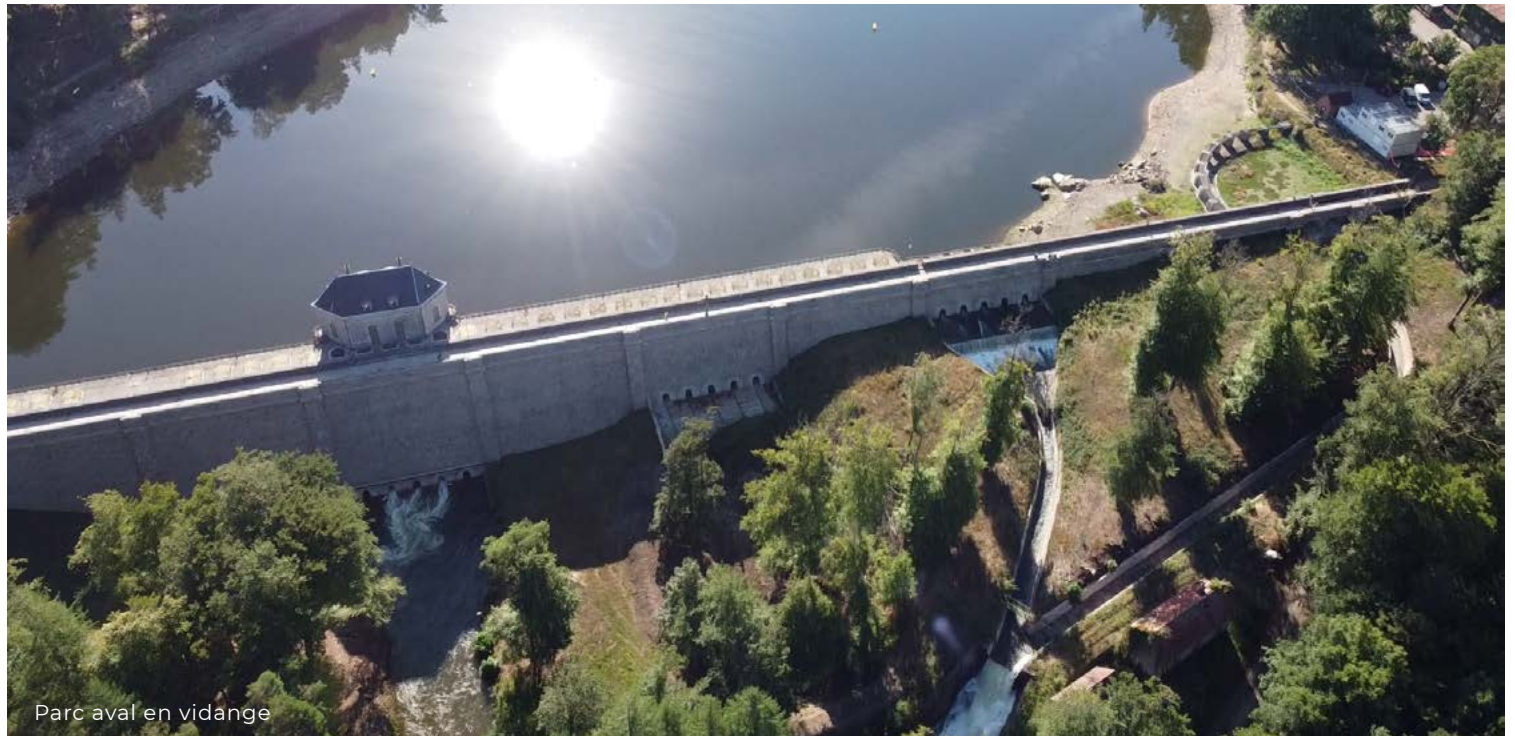
Parc aval en vidange