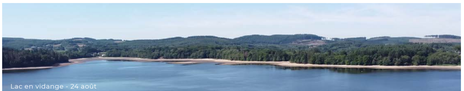
Lac en vidange - 24 août