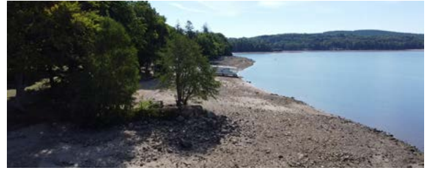
Berge dénoyée vers l'épi des Branlasses - 24 août