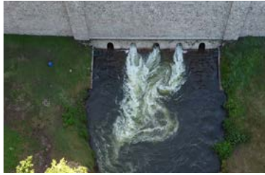
Lâcher par les vannes de fond