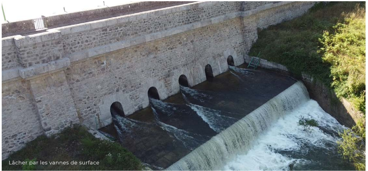
Lâcher par les vannes de surface