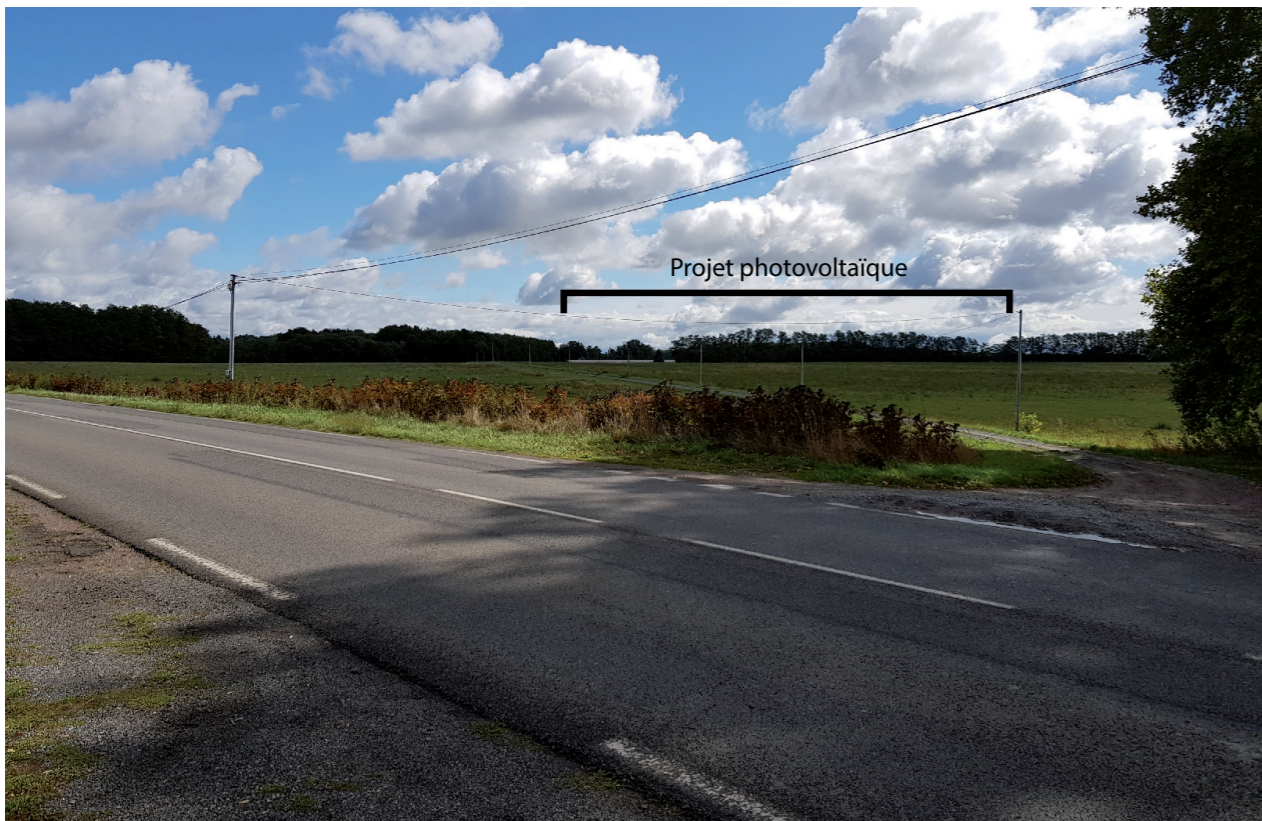
PHOTOMONTAGE 1 - Phase exploitation sans haie paysagère

PHOTOMONTAGE 1 : Vue depuis la route départementale D981 au niveau du lieu-dit Le Four à Chaux.