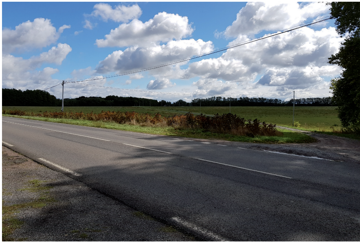
PHOTOMONTAGE 1 - Situation existante