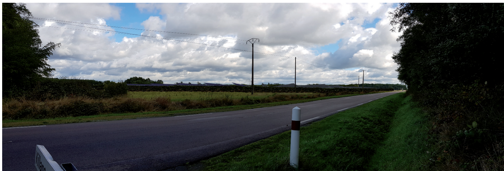
PHOTOMONTAGE 2 - Phase exploitation avec haie paysagère