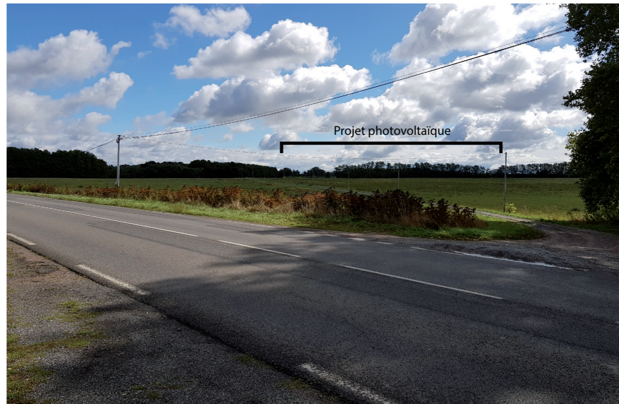
PHOTOMONTAGE 1 - Phase exploitation avec haie paysagère