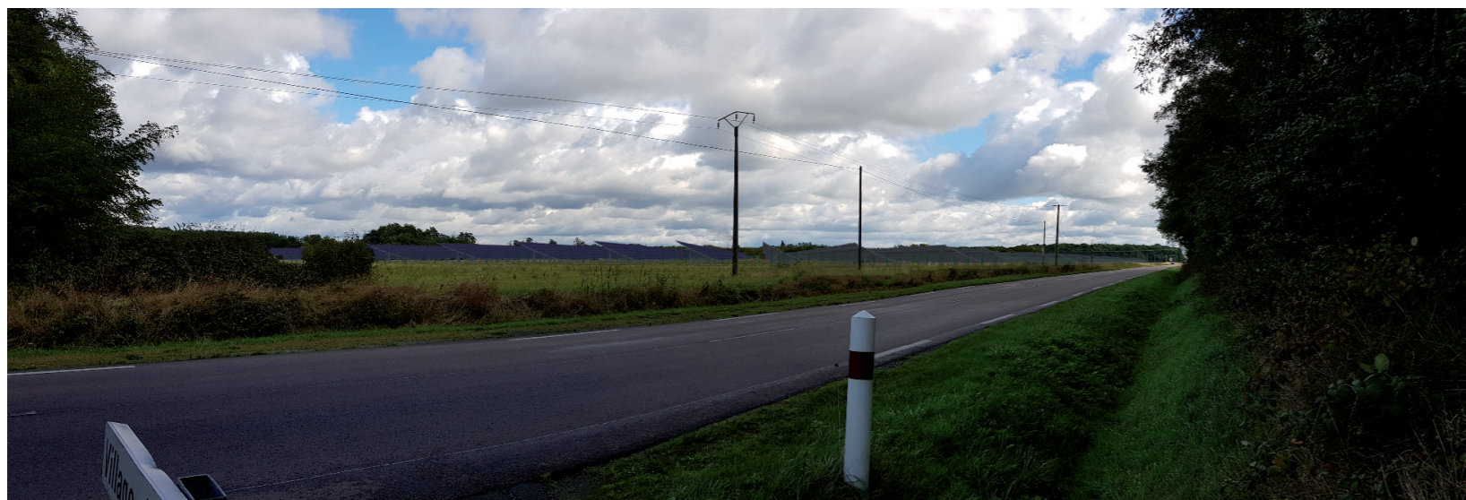
PHOTOMONTAGE 2 - Phase exploitation sans haie paysagère