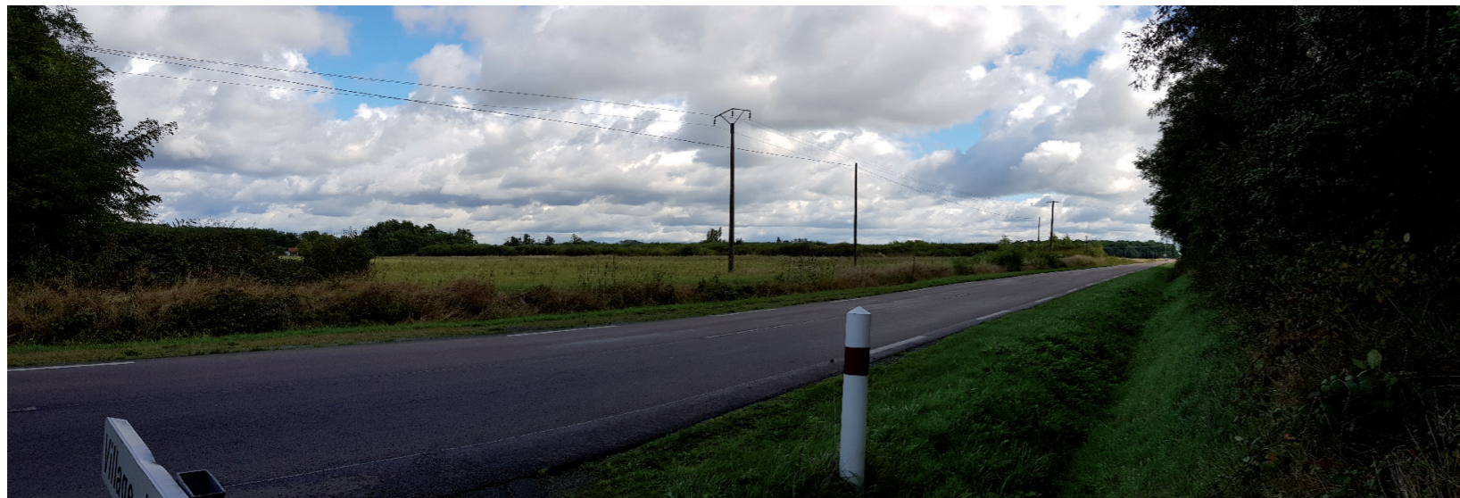
PHOTOMONTAGE 2 - Situation existante