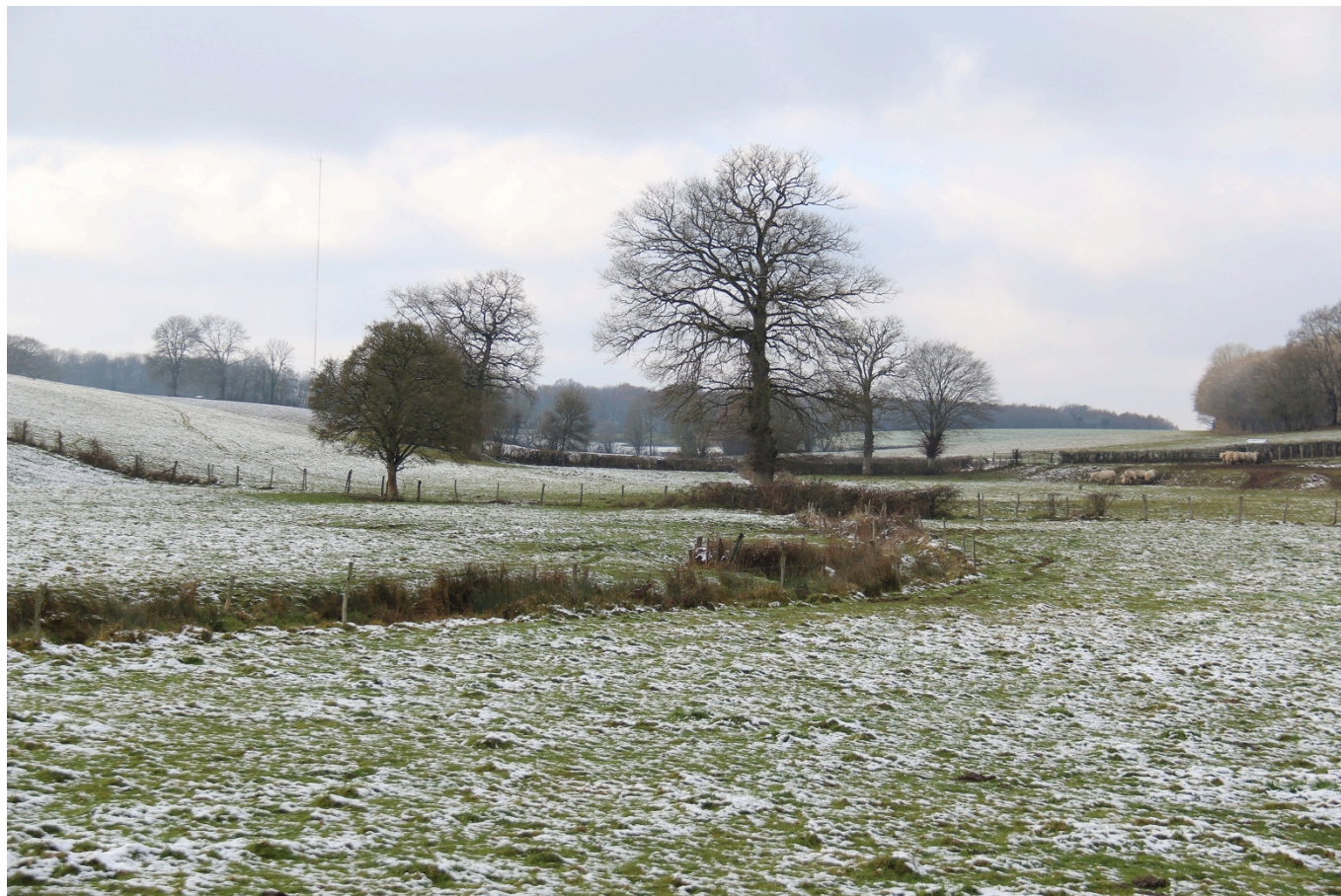
Bocage dégradé

Au cœur de la dépression argileuse du Bazois (carte 1), le paysage présent dans le polygone de la zone éolienne pressentie par Global Wind Power est un paysage agricole constitué de parcelles cultivées pour l'essentiel.