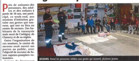
SECOURS. Parmi les personnes initiées aux gestes qui sauvent, plusieurs jeunes.