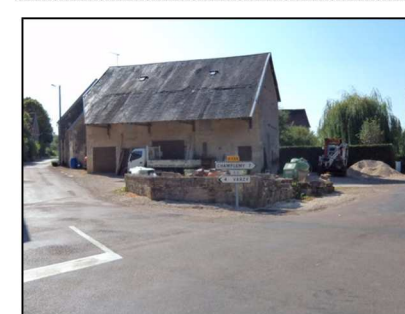
Localisation + photo