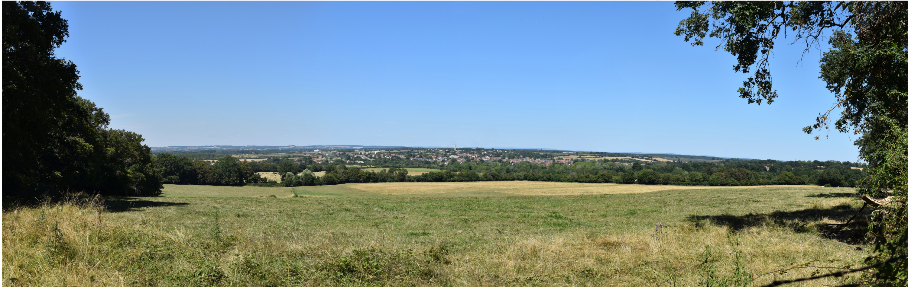
PV2 - Panoramique vue depuis le sentier de randonnée au sud-ouest du site à proximité du lieu-dit la Baravelle