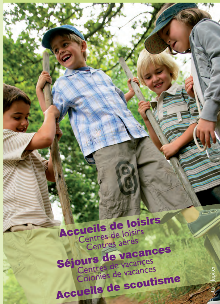
Maquette : Colette Vernet - MSS/06/2009