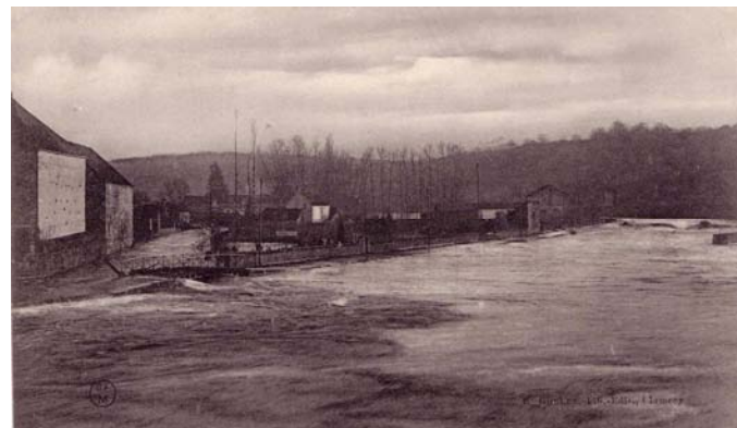
« L'Yonne en crue en 1910 »