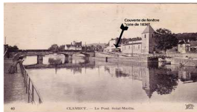
« Niveau de la crue à Clamecy en 1836 »

L'analyse de la répartition spatiale des épisodes montre que les crues les plus importantes de l'Yonne sont toutes liées à des phénomènes d'ampleur au moins régionale (crue de la Loire, crue de la Seine). Les phénomènes locaux peuvent être exclus dans les hypothèses de crues équivalentes à la centennale.