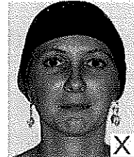
Sans foulard, serre-tête ou bandeau Visage bien droit