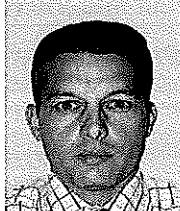
Dents non visibles Bouche fermée