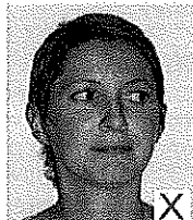
Regard de face Visage bien droit