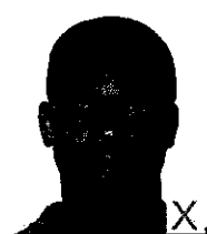
Photo ni sombre, ni tachée, ni coupée